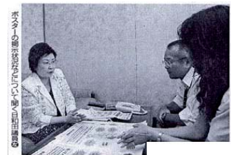
公明市議の提案する

化学物質過敏症（CS）とは、さまざまな種類の微量化学物質に反応して苦しむ症状で、重症になると、仕事や家事が出来ない、学校へ行けない…など、通常的生活さえ営めなくなる、極めて深刻な“環境病”です。国内の成人潜在患者は推定70万人との研究もあるが認知度が低く、周囲の無理解に苦しんでいる患者さんも多いのです。今年3月の議会でCS周知の為のポスター掲示などを提案しておりましたが、この度熊本市庁舎など10箇所に計23枚のポスターが掲示されました。また、10月1日付で国の病名認定を受け、健康保険が適用されやすくなっています。