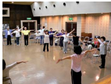
健康くまもと21体操の様子

http://www.kenkumakun.krnet.ne.jp/06_02.html