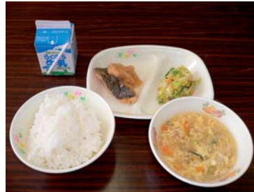
学校給食現場の献立