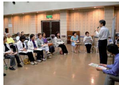
後期高齢者医療制度勉強会の様子

後半は国民健康課の職員の方をお招きし、後期高齢者医療制度の勉強会を行いました。制度についての質問が多々あり、職員の方々の熱心な説明を受けました。