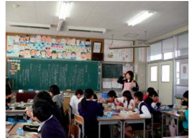
栄養士の方の説明