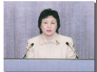
女性専門外来について質問 （昨年12月市議会）