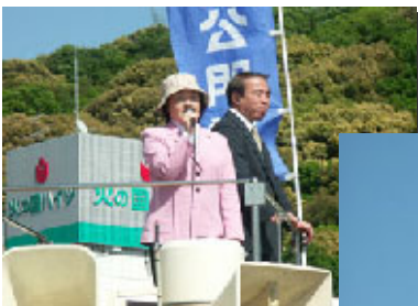
火の国ハイツ前にて